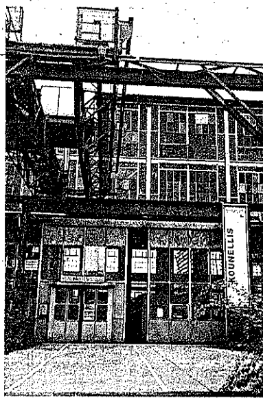
Halle Kalk buiten en binnen.

Na veel heen en weer gepraat werd uiteindelijk besloten de cul-